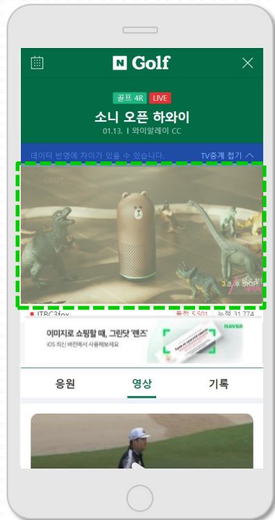
[ Mobile 생중계 ]